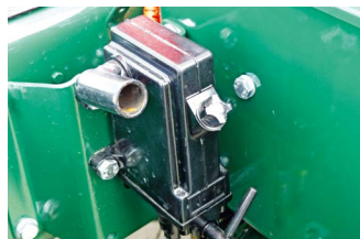
Podnoszenie odchylanej kabiny odbywa się poprzez „pompowanie” hydraulicznego lewarka