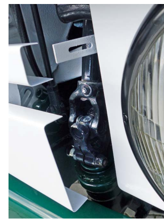
Przegub układu kierowniczego to najbardziej wysunięty do przodu mechanizm Scanii