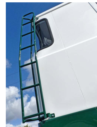
Drabinka prowadzi do bagażnika, na którym kierowcy wozili np. skrzynkę z napojami