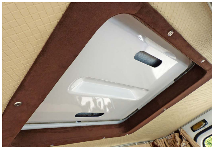
W tamtych czasach klimatyzację miały tylko ciężarówki jeżdżące na Blisko Wschód. W Europie musiała wystarczyć zwykła kłapa w dachu