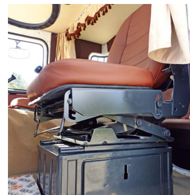
Tak amortyzowany fotel był pod koniec lat 70. szczytem luksusu w ciężarówkach