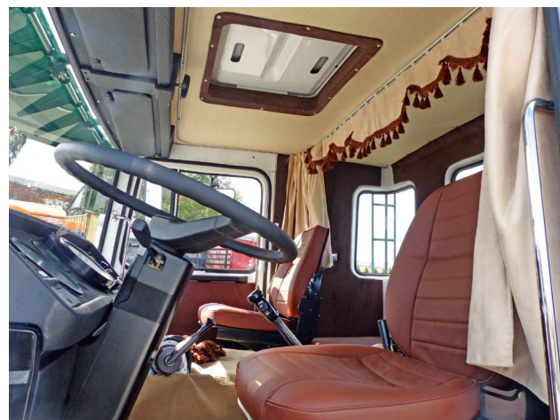
Tapicerka wewnątrz kabiny Scanii została w całości wymieniona na nową. Wykonano ją oczywiście także w Polsce

PO WIELU LATACH wyłożonej pracy w transporcie, sędziwy ciągnik znajdował się w dość opłakanym stanie, jednak jego wyjątkowa historia oraz oryginalny ►