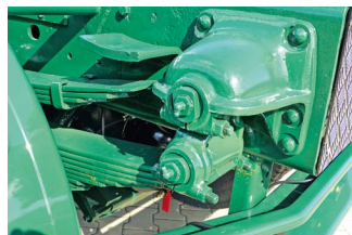
Gdy ciągnik nie ma naczepy, jechał z mechanicznym zawieszeniem dając się kierowcy we znaki