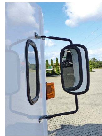
Lusterko umieszczone na dole prawych drzwi przydaje się w ruchu lewostronnym