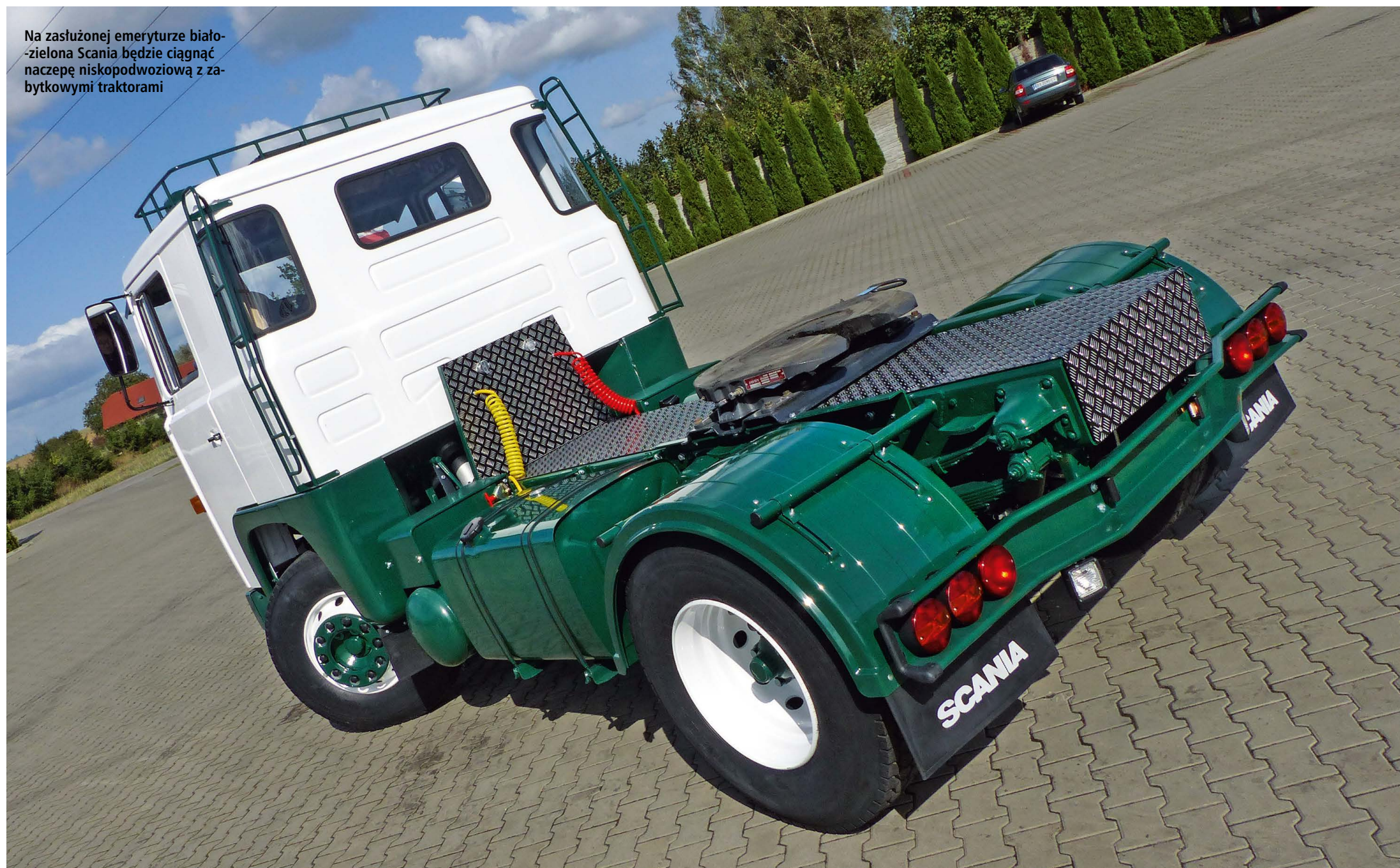
Na zasłużonej emeryturze białozielona Scania będzie ciągnąć naczepę niskopodwoziową z zabytkowymi traktorami